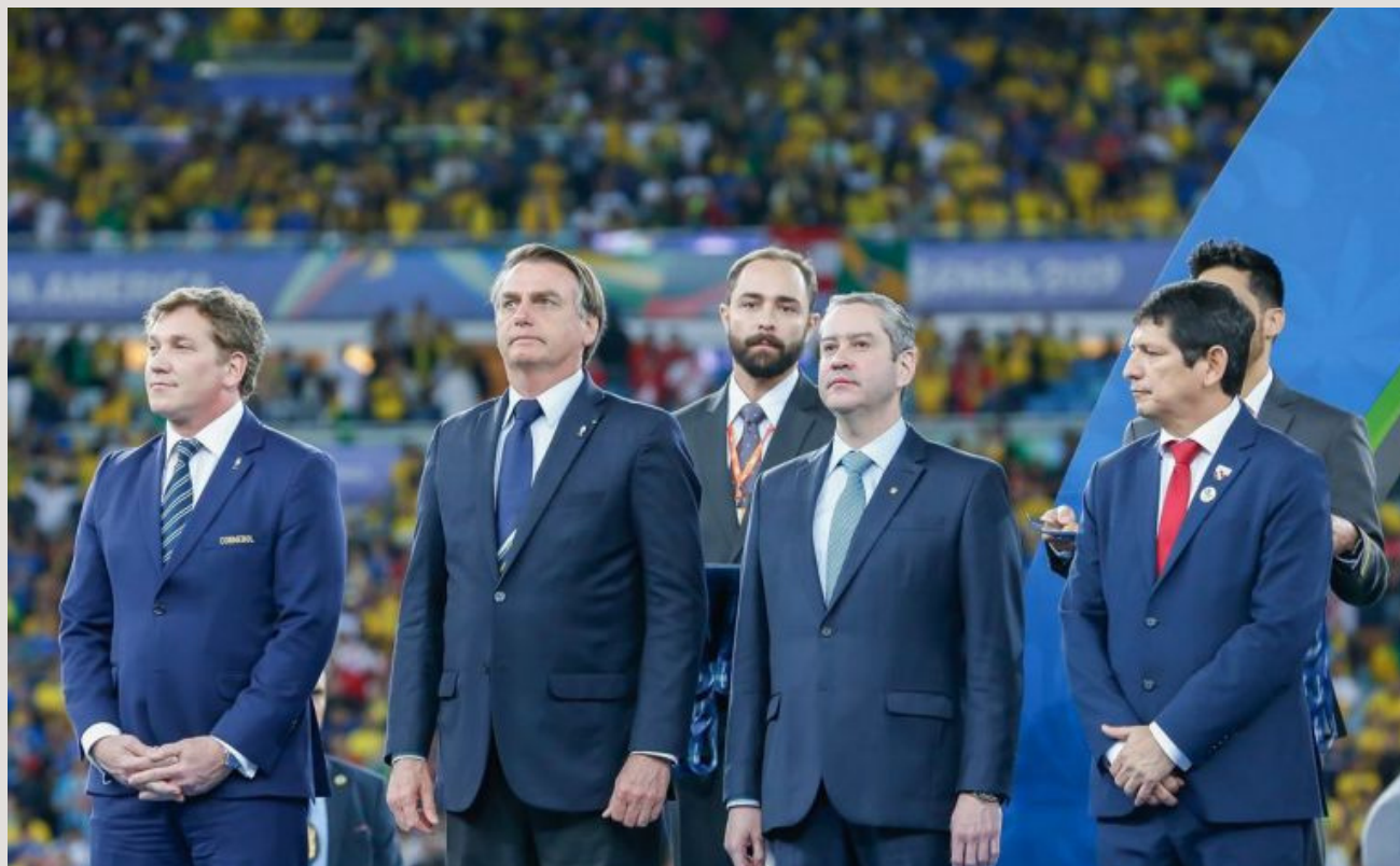
Bolsonaro aceitou o pedido da Conmebol em poucas horas, diferente da oferta de vacina da Pfizer, que demorou quase três meses para ser respondida pelo governo federal