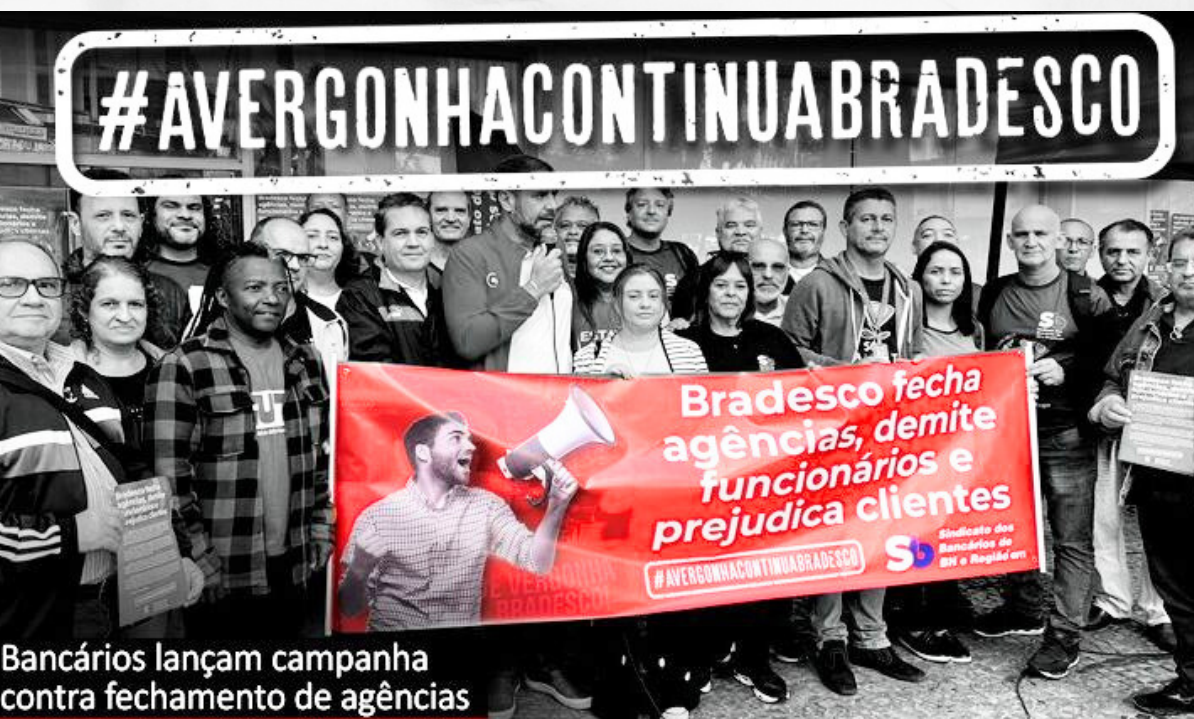
Bancários lançam campanha contra fechamento de agências

Nesta quarta-feira, 31/05, sindicatos de bancários de todo o Brasil lançaram a campanha #AVergonhaContinuaBradesco. A iniciativa, idealizada pela Comissão de Organização dos Empregados (COE) do Bradesco, tem como objetivo protestar contra o fechamento de agências e as demissões que ocorreram nos últimos meses. As ações tomadas pelo banco sobrecarregaram aqueles que ainda permanecem trabalhando. Além disso, os clientes e a população como um todo são