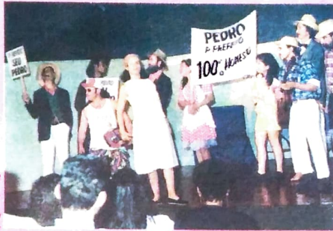
TEP apresentando a peça "Uns fé de menos, outros fé demais"

Atualmente, o TEP apresenta a peça "Auto Com-padecida", de Ariano Suassuna. O grupo é uma referência cultural em Paranavaí e região.