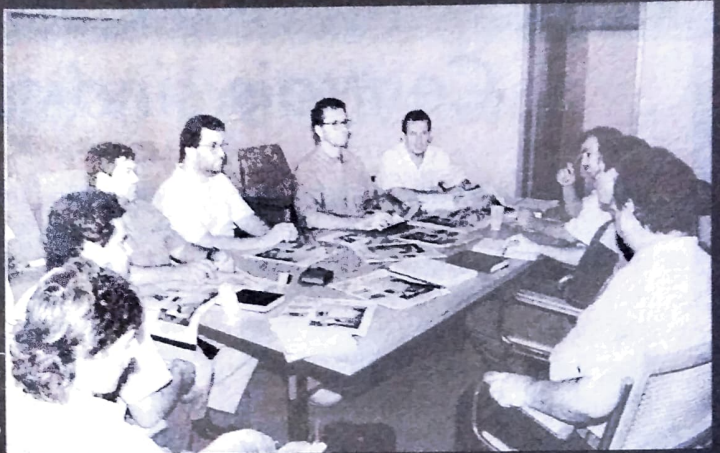
Reunião sobre unificação em Campo Mourão

A Central defende a unificação como condição para os trabalhadores enfrentarem as dificuldades que as transformações tecnológicas impõem no mundo, como desemprego e redução salarial.