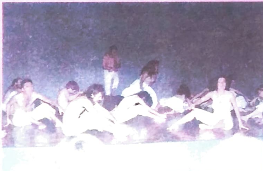
"Arena conta Zumbi", do grupo TEP