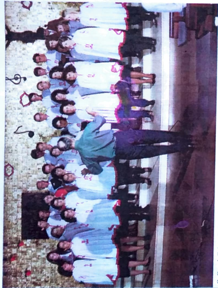
O Coral Cristo Rei, de Toledo, sempre contou com a participação dos bancários da cidade. A riqueza cultural de Toledo, o nome do município para outras cidades e estados. Já realizou

apresentações no Rio de Janeiro (Sala Cecília Meirelles), no Mato Grosso (em Dourados), e em Santa Catarina (Joaçaba). No Paraná, o coral participa ativamente, em todo o oeste do Estado, de festivais e apresentações exclusivas.