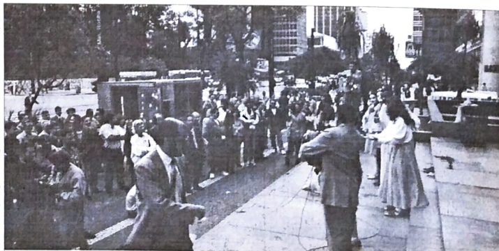
Manifestação dos funcionários do Bamerindus, em frente ao BC, de São Paulo.

Para os próximos dias deverá sair o empréstimo de R$ 6 bilhões para o Bamerindus. Este empréstimo depende de apoio dos parlamentares que compõem a base de sustentação do governo FHC, pois se trata de um