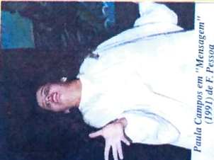
Paula Campos em "Mensagem" (1991) de F. Pessoa

ATORES/PLATEIA “O Projeto Chaplin/96 é a confirmação de que o teatro em Paranavai é atuante. Constitui-se num arrojado programa de incentivo à criação e desenvolvimento