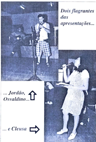
Dois flagrantes das apresentações...

A direção do sindicato aproveitou o final da copa e