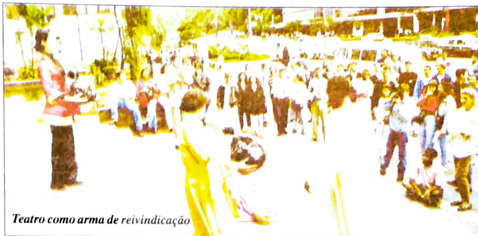
Teatro como arma de reivindicação