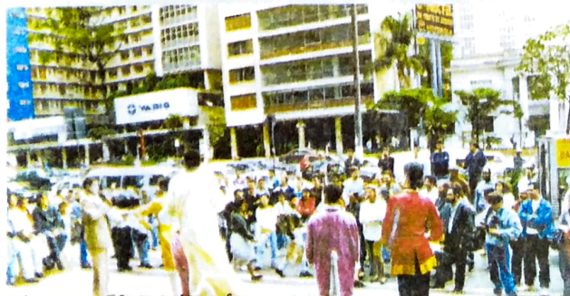
A representação teatral transformou-se em um dos pontos altos das reivindicações dos bancários, em vários estados do País