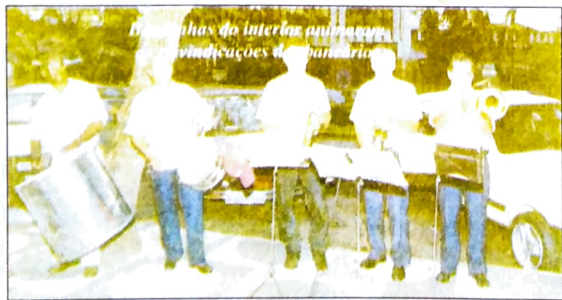
Peças teatrais de intermédio para as reivindicações dos bancários