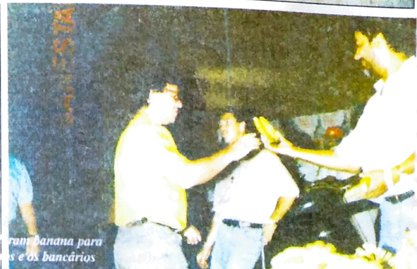
ram banana para... s e os bancários