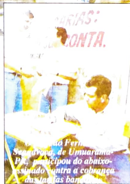
...a Fern... de Umaraima... participou do abaixo-assinado contra a cobrança das tarifas bancárias.