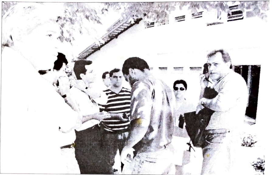
Dirigentes sindicais negociando com o representante do Banestado (com a mão no pescoço).

Ao tomarem conhecimento da iniciativa, os sindicatos da CUT, juntamente com a FETEC estadual, entraram em ação visando participar da