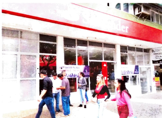
Pactu realizando paralisações em agências do Santander e Itaú