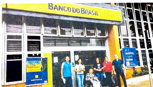
Manifestação do Pactu no BB de Campo Mourão

O governo Temer implementa seu projeto de privatização e assim satisfaz a sanha dos mercados nacional e internacional. Começou com setor de energia e dá sinais de que vai privatizar os bancos públicos.