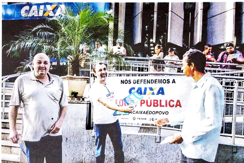
Campanha em defesa da Caixa 100% Pública realizada pelo Pactu, em Umuarama

A Caixa pretende reabrir seu Programa de Demissão Voluntária (PDV) para reduzir a despesa com pessoal. Os interessados terão o mês de fevereiro para se inscrever. O banco diz que o objetivo da instituição é bater a proposta estipulada, no ano passado, de desligamento de dez mil funcionários. Em 2017, o banco realizou dois programas de demissão voluntária, que resultaram na demissão de 7,3 mil pessoas. Atualmente, a Caixa tem 88 mil funcionários. Para o movimento sindical, demissão significa sucateamento.