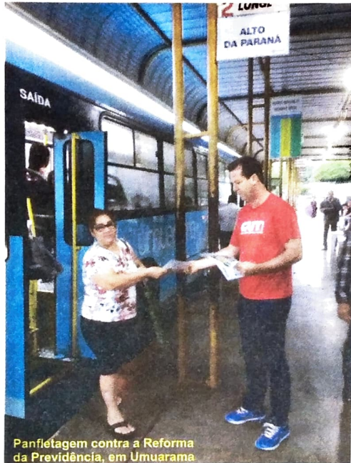
Panfletagem contra a Reforma da Previdência, em Umuarama

Na tentativa de construir uma saída honrosa para a derrota anunciada na Reforma da Previdência, caso fosse à votação, o governo Temer quis fazer parecer que a retirada definitiva da "reforma" na pauta do Congresso Nacional se deu por causa da intervenção militar no Rio de Janeiro. Na verdade, em novembro do ano passado Temer já previa a