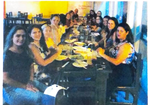
Comemoração com Happy Hour em Nova Esperança, base do SEEB Paranaíba

No Pactu foi celebrado com ações motivando a luta pelos direitos das mulheres, além de confraternizações.