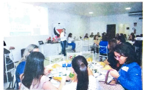
Em Toledo, o Sintrafi comemorou o Dia da Mulher com um workshop sob o tema "De bem com você"