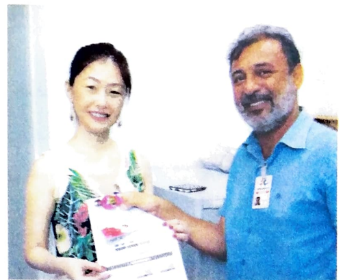
Em Campo Mourão e Umuarama (foto) foi entregue uma lembrancinha com mensagem política valorizando as mulheres e suas conquistas. Já em Guarapuava o evento iria se realizar no dia 23/03