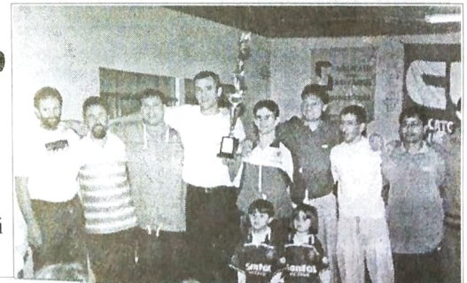
O HSBC recebeu o troféu de campeão

Terminou no dia 03 de julho o Campeonato Interbancários de Suíço/99 promovido pelo SEEB de Guarapuava. Oito times participaram da competição iniciada no dia 27 de março. A equipe do HSBC foi a campeã. Em segundo ficou o