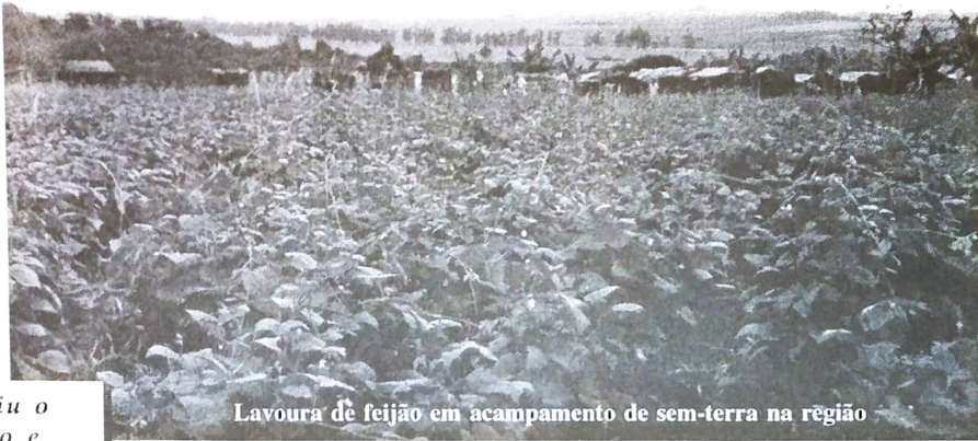
Lavoura de feijão em acampamento de sem-terra na região

FHC mentiu o tempo todo e ainda conseguiu quebrar a agricultura nacional e inviabilizar a reforma agrária.