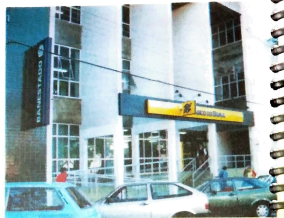
O Banestado, o Banco do Brasil e a CEF são T

recursos são direcionados para os "serviços da dívida externa". Ou seja, para pagamento de juros. E o governo FHC parece determinado a ir até o fim com as privatizações. Agora chegou a vez dos bancos públicos federais. Disso ninguém mais tem dúvida, até porque pouca coisa resta além da Petrobras para ser vendida e FHC dá sinais de desespero frente ao rombo nas contas públicas, pois em 1994 era de US$ 175 bilhões e no final de 1998 já ultrapassava US$ 300 bilhões.