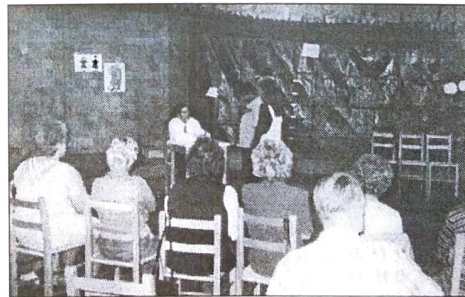
A peça retratou o drama do desemprego

Esse é o título da peça teatral apresentada em Toledo por um grupo de ativistas formado por estudantes, membros de pastorais e voluntários, com apoio do movimento sindical de Toledo. A peça já foi apresentada em escolas de primeiro e segundo grau e em outros segmentos da sociedade local. Além de retratar o drama do trabalhador desempregado, os atores tentam repassar ao público o medo que ronda aquelas pessoas que têm emprego mas que podem perdê-lo devido à política neoliberal abraçada por FHC e LERNER por imposição do FMI. O ponto mais importante, entretanto, fica para o final de cada apresentação, quando é feito um debate com o público sobre a situação do país e o que se pode fazer para mudar o quadro atual.