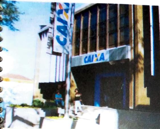
mentais para o desenvolvimento econômico