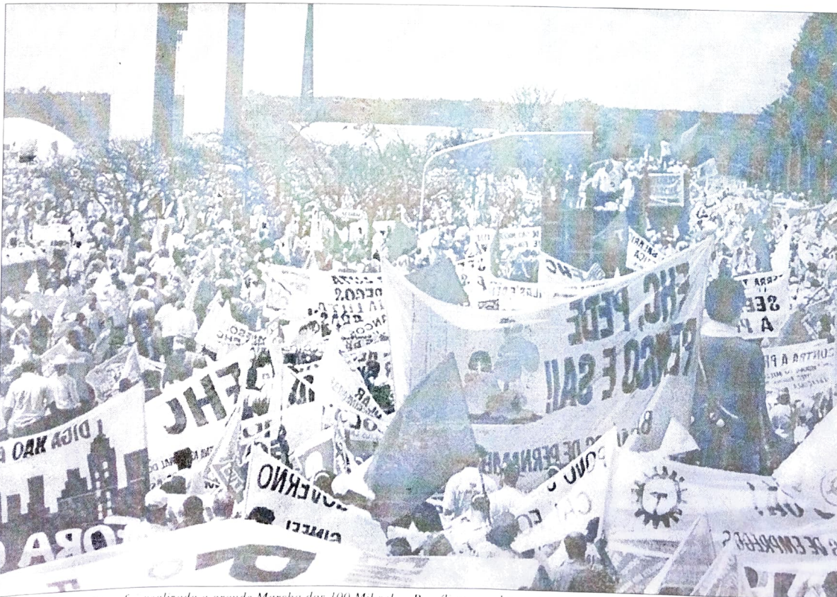
No dia 26 de agosto foi realizada a grande Marcha dos 100 Mil sobre Brasília, uma das maiores manifestações dos últimos anos

Esse foi, sem dúvida, um período de grandes lutas. O movimento sindical teve participação decisiva na campanha pelas eleições diretas e a retomada do voto democrático, ainda no final da década de 80. Poucos anos depois, saía às ruas novamente para exigir o impeachment de Fernando Collor. Desde então, a CUT e o movimento sindical têm atuando de forma veemente por uma política capaz de melhorar a condição de vida dos trabalhadores e das camadas sociais desassistidas. Nos últimos anos, a presença do movimento sindical tem sido tão forte quanto antes. Sobretudo em 99, quando tivemos a greve nacional dos caminhoneiros, paralisando o transporte rodoviário em todo o país, a Marcha dos 100 Mil sobre Brasília e a Paralisação Nacional que teve a adesão de 1,5 milhão de pessoas, no último dia 10 de novembro. As duas últimas convocadas pelo Fórum Nacional de Lutas, com importante participação da CUT. Mobilizações essas que mostram que, como no início do século, apesar de todas as tentativas do governo de obstruir o movimento sindical, a disposição de luta e resistência ainda será, por muito tempo, a arma mais forte para enfrentar os ataques conservadores