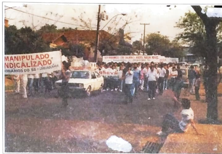
Greve dos Bancários de Umuarama em 1985