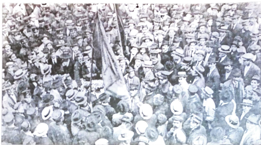
A primeira grande greve da história sindical brasileira nasceu em São Paulo, no dia 9 de julho de 1917. Os operários exigiam aumento de 25%, mas as manifestações de rua foram duramente reprimidas pela polícia. A greve durou sete dias.

lembrar que o sindicalismo no Brasil começou em meados do século passado. Já em 1858 houve, com êxito, uma greve da Imperial Associação Tipográfica Fluminense, do Rio de Janeiro, reivindicando um aumento salarial. Este fato teve grande influência sobre o desenvolvimento, posterior, do movimento sindical no país.