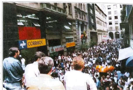
Fechamento do Centro Financeiro de São Paulo, na Campanha Salarial de 1998

Uma das propostas da CUT para a superação da atual estrutura sindical, como forma de fazer frente aos ataques neoliberais sobre os direitos dos trabalhadores, é a unificação dos sindicatos. Nesse sentido, o Paraná foi um dos Estados a dar os primeiros passos. No final de 1995 foi aprovada a unificação dos sindicatos de bancários de Paranavaí, Assis Chateaubriand, Campo Mourão, Toledo e Umuarama (que depois incluiu também o de Guarapuava). No ano seguinte foi oficializada a criação do PACTU. Desde então esses sindicatos vêm realizando campanhas unificadas, com resultados significativos para a categoria. Com a unificação, o PACTU tem se mostrado entre os sindicatos que mais mobilizam em todo o Brasil. E pode ficar melhor. Os sindicatos do PACTU já estão dando um passo à frente, rumo à criação do Sindicato Regional dos Trabalhadores do Sistema Financeiro. Esse sindicato vai ter um poder de intervenção política bem maior, com capacidade e estrutura suficientes para fazer frente às investidas do governo e dos banqueiros sobre os direitos dos trabalhadores.