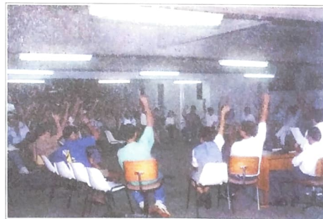
Assembléia de filiação do Sindicato dos Bancários de Paranavaí à CUT, em dezembro de 1993