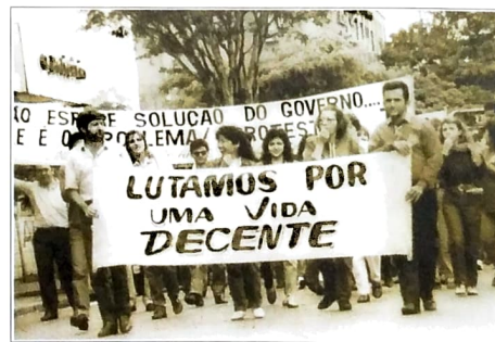
Greve Geral dos Bancários em Campo Mourão, em 1986