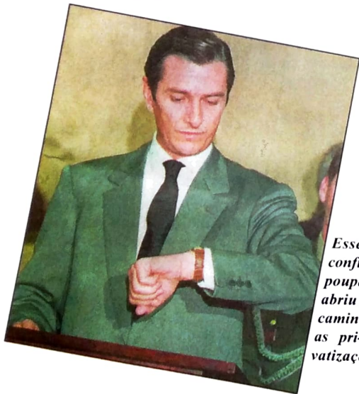
Esse confisou a poupança e abriu caminho para as privatizações...

Itamar Franco manteve as privatizações e a abertura indiscriminada da economia. Além disso, foi quem lançou o Plano Real, numa época em que o país já havia experimentado várias tentativas fracassadas de estabilização. E, junto com o Real, projetou o atual Presidente.