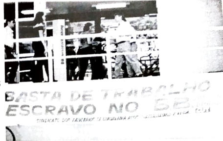
BB dificulta negociações. Sindicatos respondem com protestos, paralisações e greve marcada para 15 e 16/12/99

As comissões avaliam que, para que a proposta seja contemplada, as mobilizações são vitais.