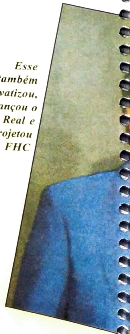
Esse também privatizou, lançou o Real e projetou FHC

instituições lucraram mais de apenas um mês de instabilidade reajustado em míseros 6 reais pela política neoliberal de Collor, pior do que a malfadada década de crescimento médio inferior de renda que continua absurdo modelo econômico não tem