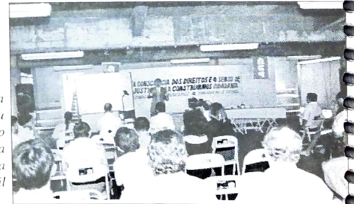
Palestra esclareceu como funciona a Previdência no Brasil

No dia 25/11 foi realizada pelo PACTU, no SEEB de Paranavaí, palestra sobre os fundos de pensão, para os funcionários do Banestado. Foi apresentado aos participantes como funciona a Previdência no Brasil, com destaque para os fundos de pensão fechados, que é o caso do Funbep.