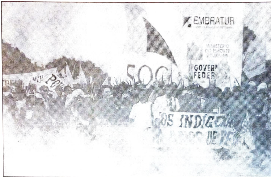
Manifestação de estudantes, trabalhadores e índios reprimida pela polícia durante a "festa" dos 500 anos do Brasil

Não bastasse o fiasco da nau capitânia brasileira, que não conseguiu navegar, o óba-óba montado em Porto Seguro para lembrar a chegada de Cabral ao Brasil acabou em repressão policial e festival de pancadaria: os índios, que apanham dos brancos desde o descobrimento, apanharam novamente nas comemorações dos 500 anos. Desta vez em companhia dos sem-terra e dos negros.