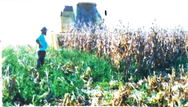
A produção de milho no acampamento foi tanta que exigiu aluguel de maquinário para facilitar e agilizar a colheita

Já em 2000, a produção cresceu mais de 100%. Só de arroz foram colhidas recentemente 2.500 sacas e o milho, que está sendo colhido, vai superar 7 mil sacas. O algodão também está pronto para a colheita. Isso em apenas 300 alqueires da propriedade. Os mais de 2 mil alqueires da fazenda já foram desapropriados pelo Incri e as 230 famílias só aguardam a emissão do título de posse das terras. A fazenda já está inclusive dividida em lotes de 7 a 8 alqueires cada um. Assim que cada família tomar posse da sua área, a produção de alimentos será muitas vezes maior. Vale lembrar ainda que toda a produção daquele acampamento foi conseguida através do esforço pessoal dos trabalhadores. Ou seja, não teve um centavo do governo. O líder do acampamento, João Kenor, disse que se a fazenda não tivesse sido ocupada, estaria até hoje abandonada e as 230 famílias que hoje lá trabalham, estariam