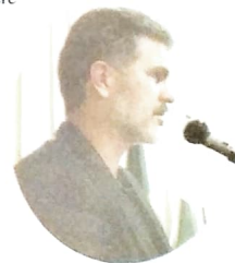
Osni: trabalho evitou envenenamento de rio que abastece Umuarama

Esses são apenas dois exemplos de como o meio ambiente tem interferência direta na vida de todos. É por isso que os sindicatos do PACTUINGÁ também repudiam a proposta do deputado