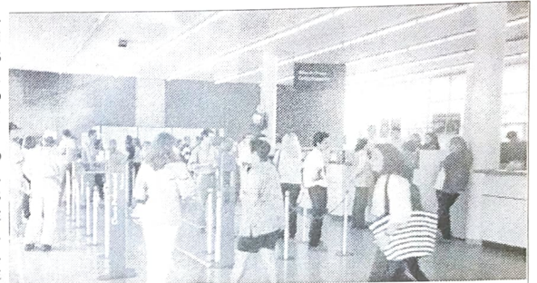
Terceirização elimina empregos e prejudica o atendimento ao público

ESSA MEDIDA, ALEM DE AUMENTAR O DESEMPREGO NOS BANCOS, CRIA OUTROS SÉRIOS PROBLEMAS. O PRINCIPAL DELES É A FALTA DE SEGURANÇA NESSES