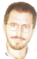
Botéquio: cuidar do meio ambiente e investir na saúde da população

de facilitar o despejo de lixo, esgotos e resíduos industriais. Ao apresentar a denúncia, o vereador observou que "esses ataques ao meio ambiente são ameaças ao futuro da população".