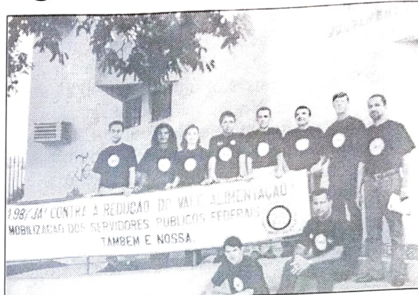
Em Umuarama, servidores da Justiça do Trabalho durante paralisação por reposição salarial e melhores condições de trabalho

O processo foi engavetado pela Procuradoria da República, mas está sendo