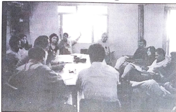
Última reunião do Conselho Político, que definiu a data da fundação do Sindicato Regional

Está tudo certo para a assembléia de fundação do Sindicato Regional dos Trabalhadores no Sistema Financeiro da região Noroeste.