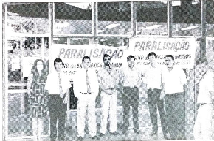
O HSBC é um dos bancos onde a campanha é intensa, já com várias atividades desenvolvidas desde o início do ano.

Este ano, a campanha vai priorizar, além do reajuste nos salários, a garantia de emprego, jornada