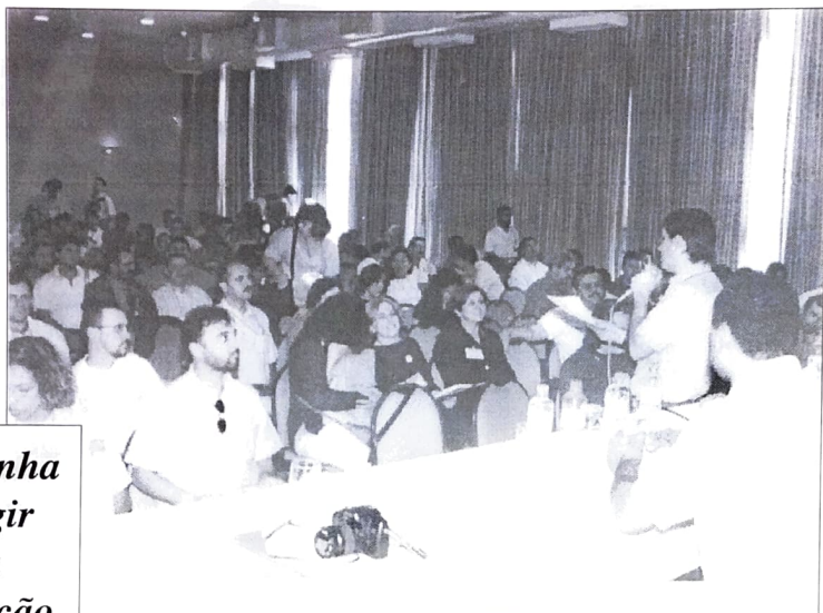
II Conferência discutiu a contratação dos trabalhadores do ramo financeiro

lução do Banco Central que permite outras empresas comerciais a realizarem serviços bancários