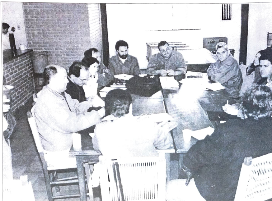
O Conselho Político do PACTUINGÁ, reunido em Toledo, discutiu adiamento da assembleia de fundação do Sindicato Regional

Além da campanha, os diretores dos sindicatos envolvidos têm que participar de outros congressos como os da Fetec, CNB, CUT Estadual e CUT Nacional. Mas, como publicamos no número anterior, todos os procedimentos para a fundação do Sin-