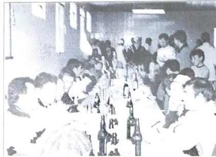
A CONFRATERNIZAÇÃO REUNIU CERCA DE 350 PESSOAS, ENTRE BANCÁRIOS E DEPENDENTES