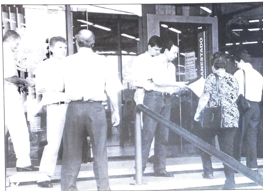
Na segunda quinzena de junho o PACTUingá fez mais uma atividade em defesa dos bancos públicos

É por isso que a estratégia de combate ao desmonte e a venda dos bancos públicos é um dos principais focos de discussão nos congressos e encontros que preparam a campanha salarial dos bancários neste ano.