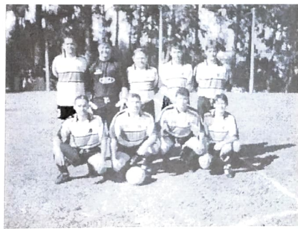
A EQUIPE DO UNIBANCO FICOU EM SEGUNDO LUGAR