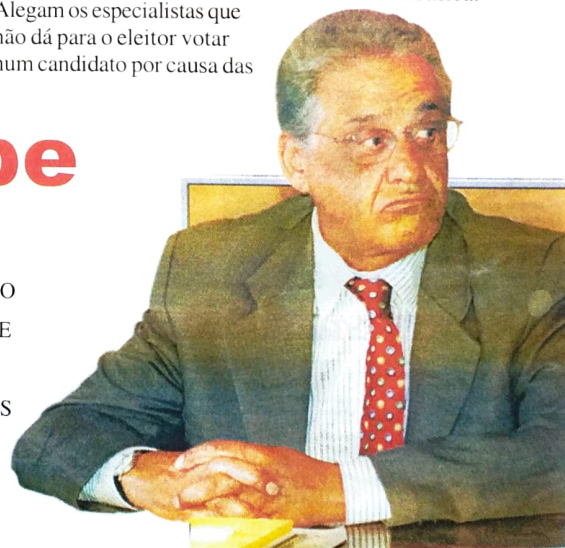
ARTICULAÇÕES DA ELITE ECONÔMICA PODEM LEVAR FHC À PRIMEIRO MINISTRO NUM SISTEMA PARLAMENTARISTA

SE ISSO ACONTECER DE FATO, COMPROMETERÁ TODA A REFORMA POLÍTICO-PARTIDÁRIA. É O ELEITOR TEM QUE ESTAR ATENTO, POIS AS PESSOAS QUE VOTARÃO UMA MUDANÇA DESSA MAGNITUDE SERÃO OS MESMOS QUE APOIAM FHC NESSE GOVERNO.