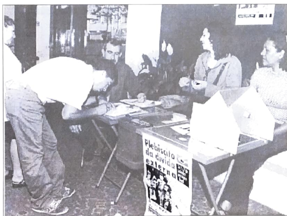
Em Campo Mourão, Pactuingá colheu milhares de assinaturas

Em todo o país, quase seis milhões de pessoas participaram do plebiscito e mais de 90% foram contra o pagamento das dívidas interna e externa e são favoráveis a realização de uma auditoria pública dessas dívidas. Também se declaram contra o acordo com o FMI.