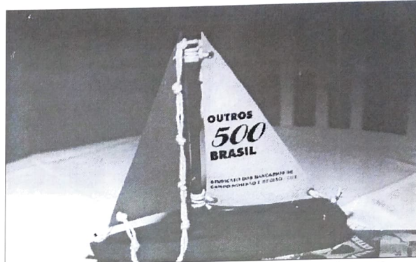
A exclusão nos 500 anos do Brasil foi tema do baile

Ainda dentro desse tema, o Seeb Campo Mourão aproveitou o baile dos bancários para promover uma exposição de fotos do fotógrafo Dilmércio Daleffe. Intitulada "O Brasil que a gente não vê", a exposição mostrou a realidade do interior de São Paulo, Piauí, periferia de Campo Mourão interior do Paraná.