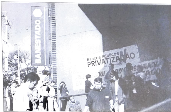
PACTUINGÁ tem feito constantes manifestações contra a privatização do Banestado

das investigações feitas pela Procuradoria Geral da República sobre os escândalos do Banestado Leasing e ilegalidades na compra dos precatórios, os sindicatos já impetraram oito ações na Justiça questionando a privatização do banco. As ações vão desde o valor mínimo estipulado para o leilão, até a questão da estabilidade dos funcionários.