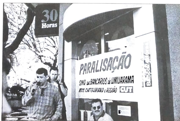
A exemplo do ano passado, só a mobilização vai melhorar proposta da Fenaban

Avalia ainda que caso fosse implementada a proposta formulada pelos banqueiros, um funcionário com cinco anos de banco, por exemplo, passaria a ter uma verba incorporada ao seu salário correspondente