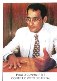
PAULO CUNHA (PT) É CONTRA O VOTO DISTRITAL

Participa quem valoriza a tarefa de se votar diretamente em alguém, ou de ser votado. Os defensores do voto obrigatório são aqueles políticos que usam o poder econômico e a miséria do eleitor para conseguir o seu voto através de uma cesta básica.