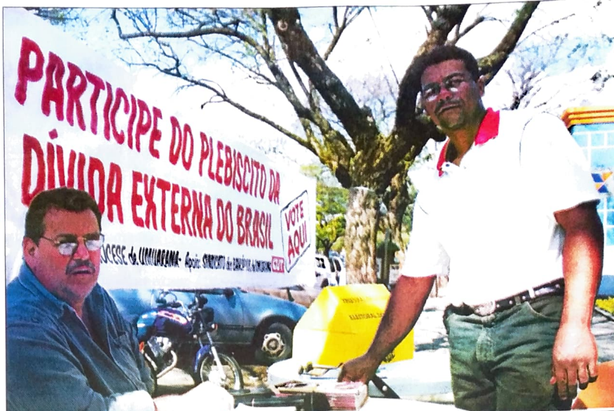
PACTUINGÁ participa do plebiscito em Umuarama

Por que a imprensa criticou o plebiscito? - Tradicionalmente, as lutas dos trabalhadores não têm conseguido grande simpatia da imprensa, seja ela um pequeno jornal, rádio ou uma grande emissora de televisão. Só para dar um exemplo, basta analisar pela freqüente campanha difamatória