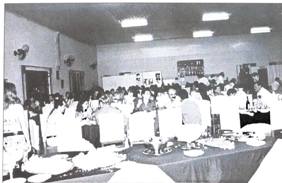
EM UMUARAMA, SALÃO LOTADO NO JANTAR DANÇANTE

A presença de mais de 150 bancários e dependentes esteve dentro da expectativa. O objetivo, além de comemorar a data, a união e as lutas da categoria, foi promover conagração entre os trabalhadores do ramo financeiro e seus depen-