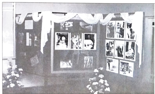
Exposição de fotos fez parte das comemorações do Dia do Bancário em Campo Mourão