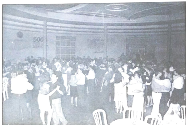
Dezenas de bancários e familiares na comemoração