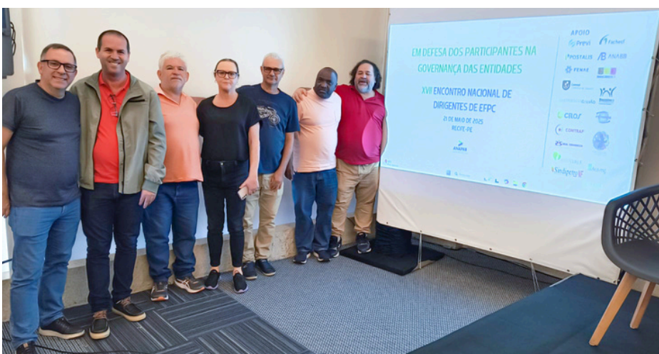
A delegação do Paraná no 26º Congresso Nacional da Anapar