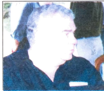
Se deixar, Lerner privatiza até as águas e as ilhas do Rio Paraná

A tática do governo Jaime Lerner não é diferente da de FHC. O Paraná tem uma empresa pública