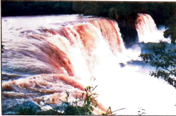
Um governo sério, ao invés de privatizar se preocuparia em preservar os recursos naturais e estratégicos para o país, como a água

Desde os primórdios da civilização, os habitantes do Planeta (salvo exceções, que sempre existiram) enfrentaram as mais difíceis situações. Em muitos casos, como no holocausto, na cruzada de Hitler contra os judeus e pela dominação do mundo ou em sucessivas guerras, custaram a vida de milhões de pessoas. Até chegar aos dias atuais, quando um outro tipo