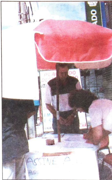
Pactuingá trabalha para revogar a lei que autoriza a venda da Copel