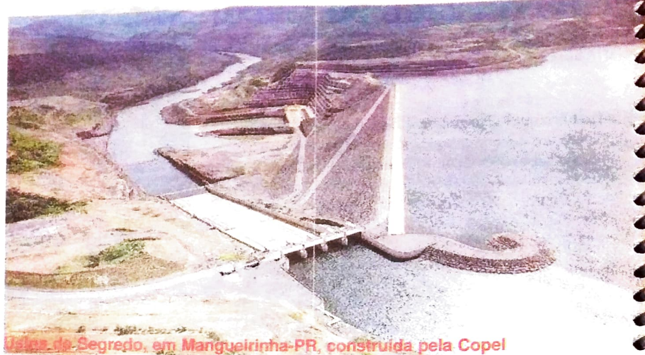
Usina de Segredo, em Manguelirinha-PR, construída pela Copel

grandes investimentos no setor hidroelétrico, a Copel encarou de frente e venceu o desafio de encontrar soluções para o abastecimento de energia elétrica em larga escala e nos anos seguintes já inaugurava as primeiras usinas hidrelétricas do Paraná. Os investimentos feitos pela Copel representam um passo fundamental na constituição da infra-estrutura indispensável para acelerar o desenvolvimento estadual. Hoje, 45 anos depois de entrar em operação, a Copel possui 18 usinas em operação, com