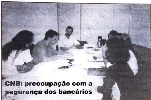
CNB: preocupação com a segurança dos bancários

A CNB promoveu no último dia 27 de maio um seminário sobre segurança bancária. Os participantes trocaram informações sobre os problemas que mais afetam a segurança dos trabalhadores bancários, bem como de cliente e usuários. O Pactuingá esteve presente e constatou que o maior problema de segurança bancária ainda são os assaltos, que diminuíram nos grandes centros e estão aumentando no interior do país. O