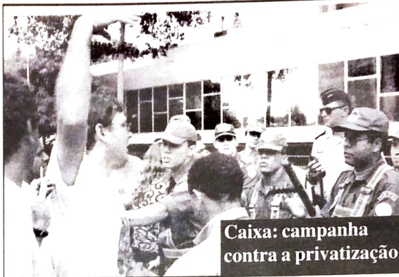
Caixa: campanha contra a privatização