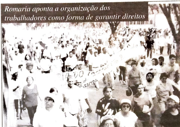
Romaria aponta a organização dos trabalhadores como forma de garantir direitos

pessoas e teve como tema "O trabalhador e a Organização". Religiosos, lideranças comunitárias e sindicais protestaram contra a situação econômica em que se encontra o Brasil. Não se furtaram em esclarecer aosromeiros que a culpa de tal situação é de FHC e daqueles que o apóiam, como Lerner e outros. Apontaram alternativas através da organização dos trabalhadores.