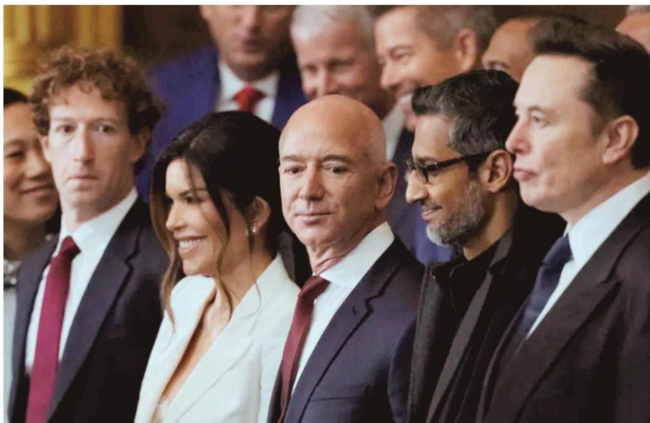
Os bilionários Mark Zuckerberg, Jeff Bezos e Elon Musk, durante cerimônia de posse de Donald Trump, no dia 20 de janeiro de 2025

Bilionários têm 4 mil vezes mais chances de ocupar cargos políticos