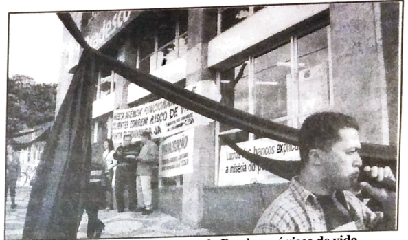
Para o Pactuingá, ser cliente do Bradesco é risco de vida