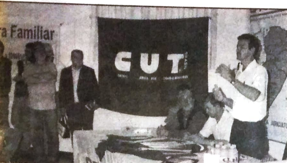
Diretor da FETRAF/SUL-CUT fala sobre a produção de alimentos da Agricultura Familiar

Organizada pela FETRAF/SUL-CUT (Federação dos Trabalhadores da Agricultura Familiar), que representa 245 municípios dos estados do Paraná, Santa Catarina e Rio Grande do Sul, a Caravana da Agricultura Familiar, foi realizada entre os dias 25 de julho e 2 de agosto, e teve o