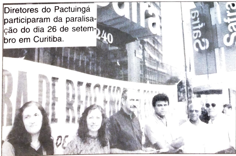
Diretores do Pactuingá participaram da paralisação do dia 26 de setembro em Curitiba.

É um projeto que democratiza as relações de trabalho. Tendo como exemplo as relações de trabalho de países europeus, como Alemanha, a França, onde a relação entre patrão e empregado é resolvida pelas organizações sindicais de ambos, sem a interferência de governos. Sem falar no piso bancário desses países. É bom lembrar que temos muitos bancos estrangeiros que operam na Europa e no Brasil, como REAL/ABN AMRO, HSBC e outros.