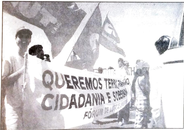
Pactuingá participou do 2º Grito dos Excluídos em Foz do Iguaçu