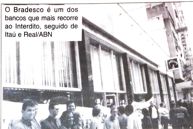
O Bradesco é um dos bancos que mais recorre ao Interdito, seguido de Itaú e Real/ABN

CNB/CUT, não cabe ação de Interdito Proibitório quando a paralisação é aprovada em assembléia e o sindicato cumpre todas as normativas da lei de greve. Além do que, o Interdito Proibitório é um instrumento do Código Civil,