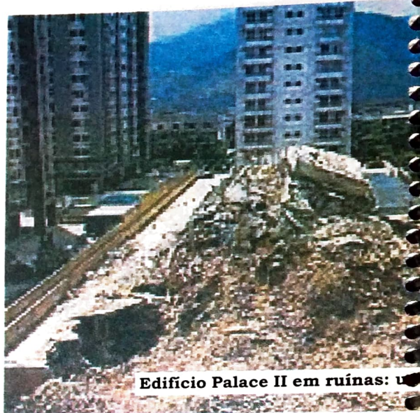
Edifício Palace II em ruínas: U

3 O terror da formação e da informação: é a falta de educação de qualidade, aquela que forma indivíduos críticos, que reivindicam cidadania. A maioria do eleitorado brasileiro, segundo pesquisas, é formada por analfabetos funcionais, aqueles que, na visão de pedagogos, sabem ler mas não entendem o que leram. E aí o terrorismo da informação os castigam. Os meios de comunicação no Brasil, com raríssimas exceções, estão nas mãos de políticos. Isso vai desde as pequenas rádios aos grandes veículos de comunicação, como jornais e emissoras de televisão. Nesses veículos, geralmente há uma linha editorial ou até mesmo de entretenimento que visa manter o povo em constante conformismo. Daí acontecem fatos como no Paraná, onde o povo elegeu e reelegeu Lerner. Nas duas oportunidades não tiveram discernimento para entender que esse homem estava e está a serviço dos interesses do FMI e do governo americano. O que é pior: nos mesmos moldes aconteceu com a Presidência da República.