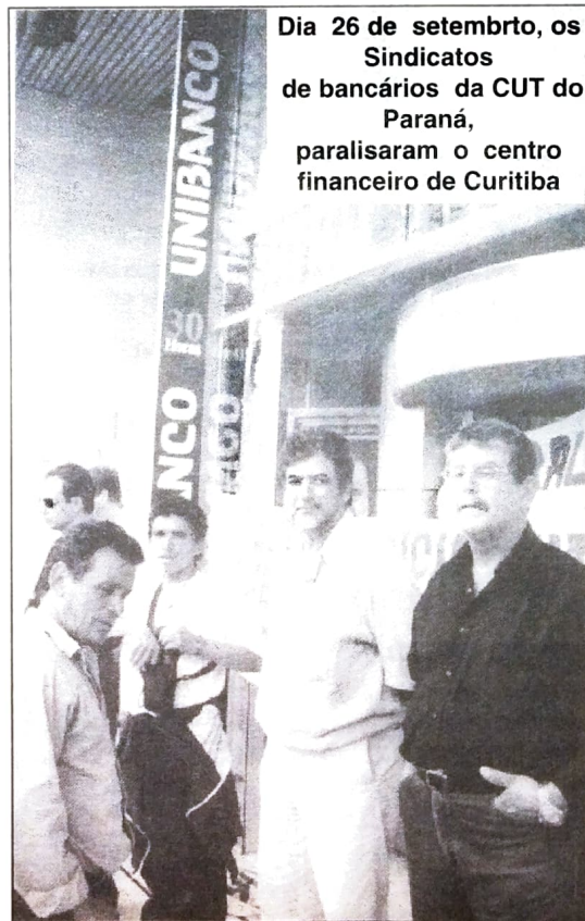
Dia 26 de setembro, os Sindicatos de bancários da CUT do Paraná, paralisaram o centro financeiro de Curitiba

As excessões ficam por conta de alguns gerentes, a exemplo do Sr. Sodrê de Campo Mourão, que desrespeitou a decisão de assembleia abrindo a agência, ficando na porta chamando os clientes para