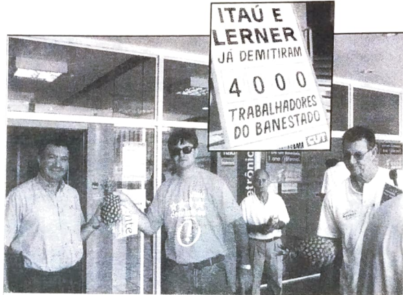
R$ 5 bilhões Lerner pegou do BC para sanear o Banestado, para pagar em 30 anos. Quem vai descascar esse abacaxi é seu filho, seu neto, seu...

No dia 17 de outubro, fez um ano que o Banestado foi privatizado. Os sindicatos de bancários da CUT no Paraná lembraram a data com manifestações em frente às agências Itaú/Banestado. Faixas e cartazes mostraram à população que já são mais de 4 mil demitidos neste período. Levando em consideração que a maioria dos pais e mães demitidas são arrimos de famílias, com em média três dependentes do seu emprego, pode-se afirmar que já são aproximadamente 16 mil pessoas que podem estar passando necessidades, devido à política privatista de Lerner. Os sindicatos do Pactuingá também lembraram a data e aproveitaram para alertar à população, que a privatização da Copel poderá ter consequências ainda piores.