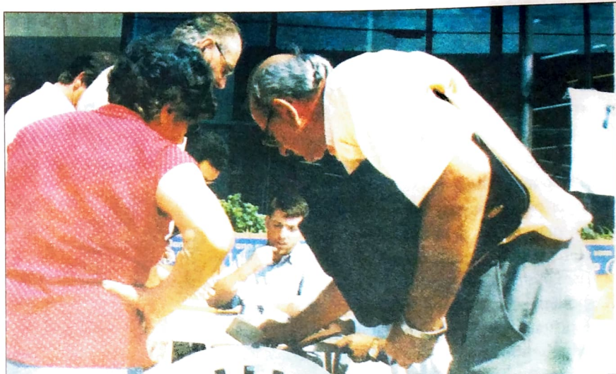
Sindicatos do Pactungá participam do Fórum e trabalharam na realização do Plebiscito