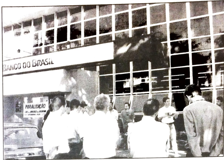
No BB, a mobilização dos funcionários está maior na campanha deste ano, o que está obrigando o Banco a negociar

* Pagamento das diferenças dos meses de setembro, outubro e novembro na primeira