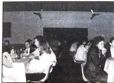
A boa participação dos bancários na confraternização do ano passado, leva o Sindicato a realizar novamente o evento

O Sindicato dos Bancários de Umuarama convida os bancários das regiões para confraternização de final de ano, programada para o dia 1º de dezembro próximo, na Chácara dos Bancários (localizada na saída para Perobal). O almoço será servido pelo Buffet Dunas, acompanhado de música ao vivo. Os ingressos custam R$ 6,00 cada e podem ser adquiridos na Secretaria do Sindicato ou reservados pelo fone (44) 622-1979. Na parte da manhã haverá jogos de volêi de areia e futebol suíço.