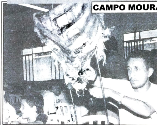
Costelão: quem já provou, sempre volta para experimentar de novo

No dia 1º de dezembro acontecerá em Campo Mourão o tradicional e delicioso COSTELÃO. É uma promoção do Sindicato dos Bancários de Campo Mourão, que além da deliciosa Constela no Chão, terá atividades esportivas durante todo o dia. Os convites podem ser adquiridos no Sindicato (fone 44 523-3492). As inscrições para os jogos de truco, canastra e futebol suíço serão feitas na hora. O sindicato convida a região para, mais uma vez, prestigiar essa grande confraternização de bancários, familiares e amigos.