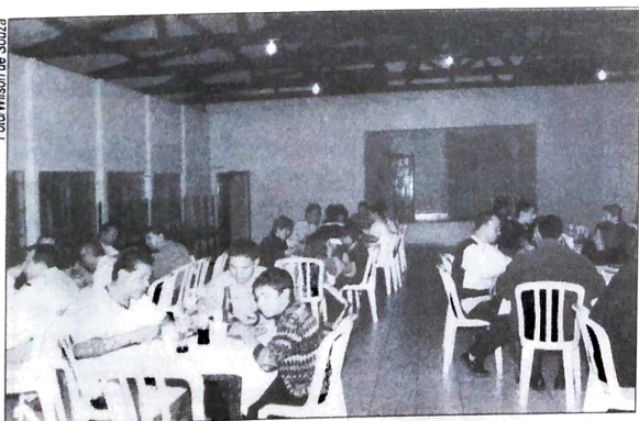
Além bate-bola, foi servido um delicioso jantar, preparado pelos bancários de Moreira Sales

O Sindicato dos Bancários de Umuarama tem realizado confraternizações com os bancários da região. No dia 29/05 foi realizado um jantar com os bancários de