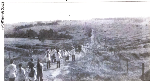
Caminhada chamou atenção da população para a consciência ecológica

A consciência ecológica, segundo estudiosos, se adquire com educação escolar, familiar e com políticas públicas de proteção ao Meio Ambiente. Em Umuarama, o Sindicato dos Bancários junto com diversas entidades e instituições promoveram a 1ª Caminhada Ecológica, com o objetivo de conscientizar pessoas e governos para a necessidade da preservação de rios e nascentes na nossa região. A Caminhada saiu do Lago Aratimbó, seguiu pela estrada Jaborandi, até o local onde Sanepar retira a água que é consumida pela po-