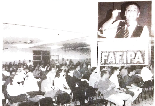
SEEBs de Campo Mourão e Paranavai promoveram debates sobre universidade pública