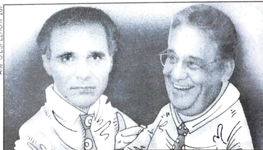
Daniel Dantas, dono do Banco Opportunity, teve encontro sigiloso com FHC, dias antes da intervenção

Desde de 1997, esse patrimônio estava sendo administrado por uma Diretoria compartilhada, que tinha três diretores eleitos pelos associados e três indicados pelo banco, sendo que as decisões eram tomadas por consenso. Nesse período, os ativos da