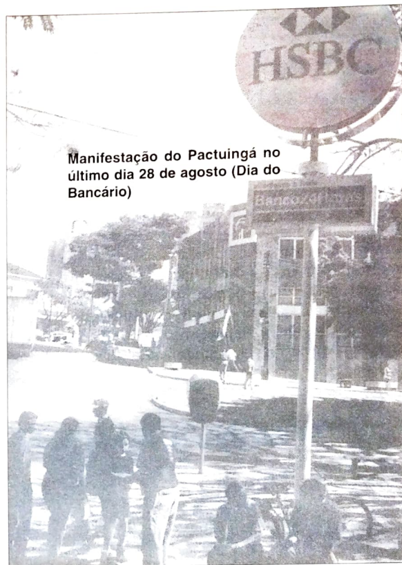
Manifestação do Pactuingá no último dia 28 de agosto (Dia do Bancário)

A excelente capacidade de argumentação e negociação dos membros da Executiva Nacional, mais o receio de manifestações relacionando os banqueiros a Serra/FHC, fizeram a Fenaban a apressar o fechamento do Acordo 2002/2003.