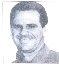
Márcio Gonçalves DEP. ESTADUAL Paranavaí