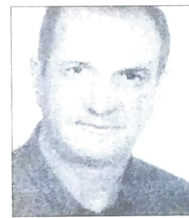
Rigonato DEP. FEDERAL N. Esperança