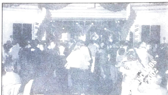
Em Campo Mourão aconteceu o tradicional Baile dos Bancários