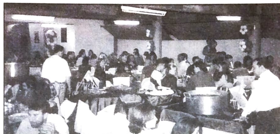
Festa dos bancários em Paranavai

Guarapuava - Promoveu uma série de atividades na sede campestre do sindicato, no dia 31 de agosto. A programação foi voltada especialmente aos filhos dos bancários.