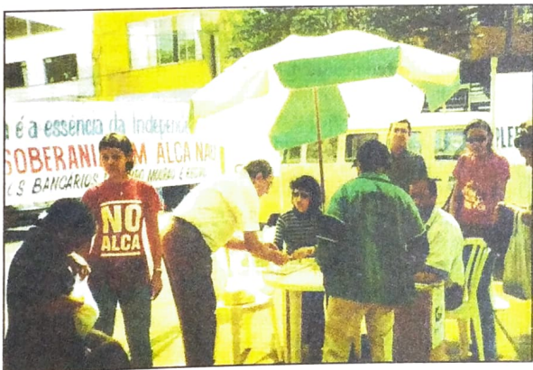
Populares votam no plebiscito da ALCA, em Campo Mourão

Os deputados que votaram contra a Copel estão querendo se reeleger