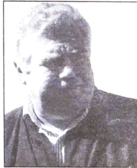
Jaime Lerner - PFL Se não fosse o povo, ele e 'seus' deputados tinham vendido a Copel

COPEL - Os mesmos das fotos ao lado, mais os da relação no quadro abaixo, também queriam vender a Copel. Não o fizeram devido a grande mobilização da população paranaense que, em sua grande maioria, manifestou-se contrária à venda da Copel, através de inúmeros atos públicos e de um plebiscito popular coordenadas por igrejas, sindicatos e, principalmente, pelo Fórum Popular Contra a Venda da Copel. Além disso, a conjuntura econômica internacional inibiu os possíveis compradores. Mas a verdade é que, se dependesse só da vontade de Lerner e destes deputados, provavelmente nossa energia estaria hoje mais cara e teríamos outros milhares de pais de família desempregados.