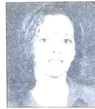
Marina DEP. ESTADUAL Paranavaí