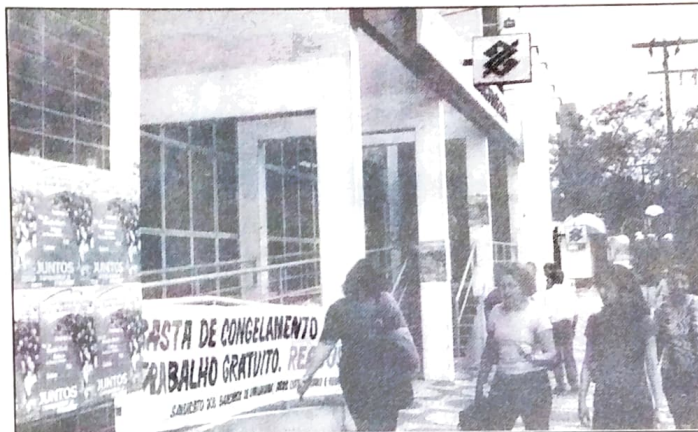
Os Sindicatos do Pactuingá se manifestaram no Dia do Espelho, no BB

R$ 823 milhões foi o lucro (recorde) do Banco do Brasil no primeiro semestre de 2002. Um aumento de 170,7% em relação ao semestre passado. No entanto, enrolação nas negociações e PLR injusta é o que o banco está oferecendo aos funcionários.