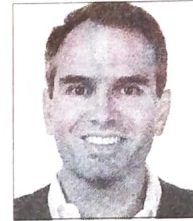
Baccin DEP. ESTADUAL Guarapuava