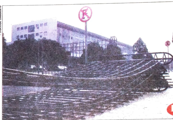
A cerca instalada por Lerner para reprimir manifestações em frente ao Palácio Iguaçu, agora retirada por Requião

Requião derruba a cerca. Auschwitz e Lerner nunca mais!