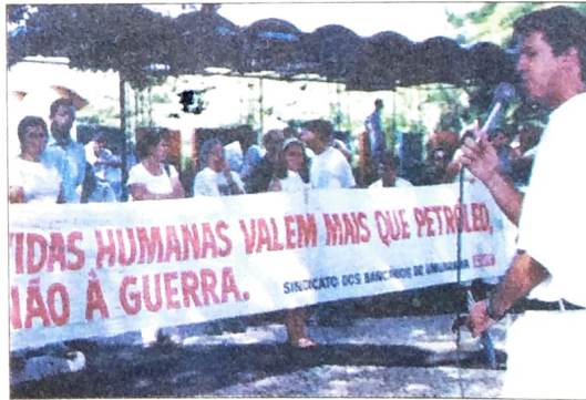
Umuarama: lideranças Sindicais discursaram após caminhada pela paz no centro da cidade

O governo norte-americano disfarça, mas não consegue esconder o óbvio. Mais do que impedir uma suposta fabricação de armas nucleares, as motivações da guerra são essencialmente ligadas aos interesses e à dependência da economia dos EUA à fonte energética do petróleo. Assim, por trás do discurso de Bush pela paz mundial, está o interesse particular dos Estados Unidos, como foram, no passado, em ações imperiais contra outros povos e países.