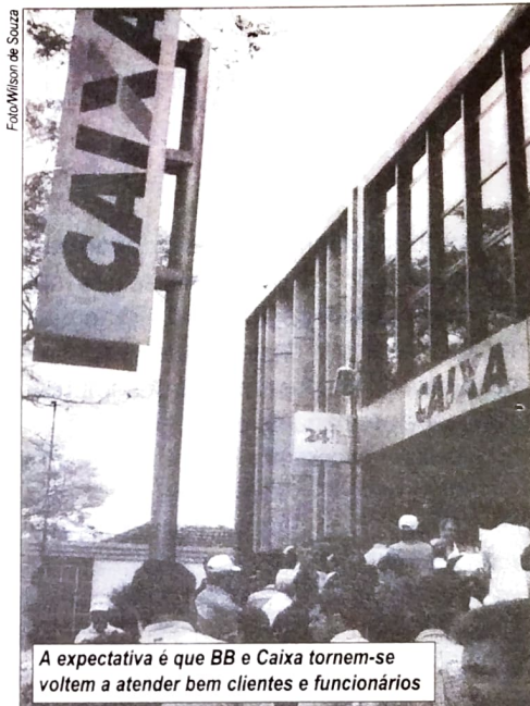
A expectativa é que BB e Caixa tornem-se voltem a atender bem clientes e funcionários

As Comissões dos Empregados do Banco do Brasil e da Caixa Econômica Federal têm se mobilizado em contatos e reuniões com as novas diretorias dos respectivos Bancos. O objetivo é abrir canais mais democráticos para as negociações salariais deste ano.