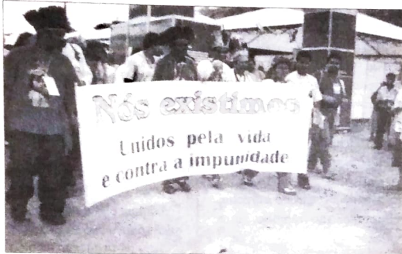
No III Fórum Social Mundial, centenas de grupos que se sentem injustiçados pela globalização econômica, apresentaram seu protesto e propostas

Foi realizado em Porto Alegre, entre os dias .... e ....., o terceiro Fórum Social Mundial. Esse Fórum foi idealizado por entidades, instituições e movimentos populares de vários países, em contraposição ao Fórum Econômico de Davos. Na visão da coordenação do Fórum Social, enquanto em Davos os representantes dos