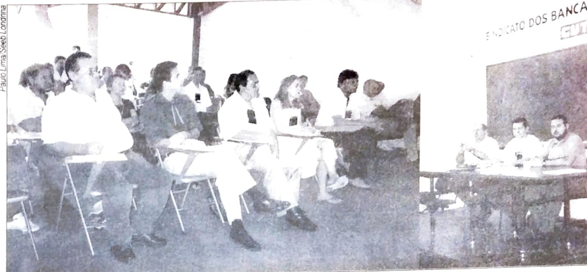
Nove diretores do Pactu participaram da Plenária da Fetec

Aprovaram também que o VI Congresso, que além do planejamento das ações, vai eleger a próxima diretoria da Fetec, será realizado na 1ª quinzena de agosto deste ano. Neste sentido, a plenária