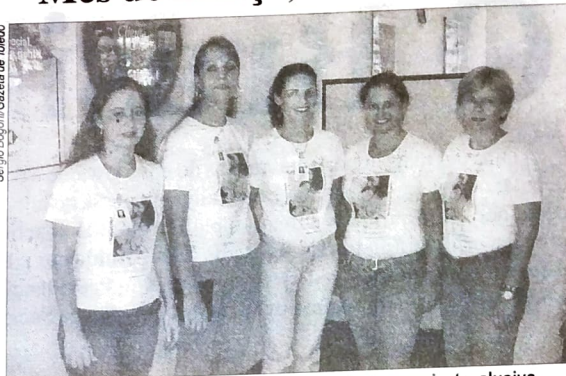
Na região de Toledo, as bancárias vestiram a camiseta alusiva ao Dia Internacional da Mulher, o que ficou bonito