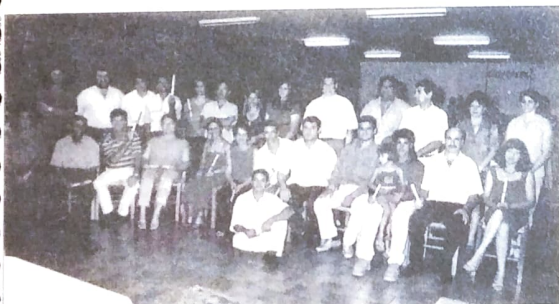
Em Toledo, 24 alunos concluíram o curso. Em Umuarama (foto à direita) foram 28, a maioria já está matriculada no ensino médio