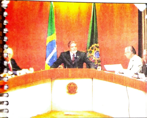
Lula consiga, com as reformas, diminuir a previdência