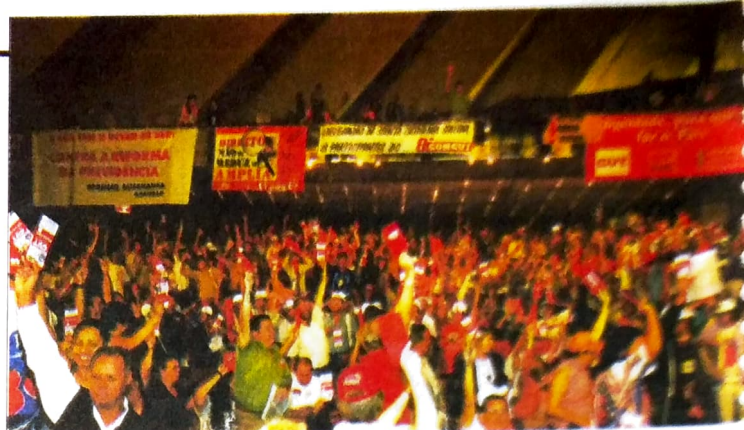
Momento de votação durante o 8º CONCURTO

Quase três mil delegados, representantes de entidades sindicais filiadas à CUT participaram do 8º CONCURTO, realizado nos dias 3, 4, 5, 6 e 7 de junho, no Centro de Convenções do Anhembi, em São Paulo. Na pauta do encontro, foi debatido o papel da CUT frente ao governo; conjuntura nacional e internacional; políticas de emprego e renda; as reformas constitucionais e a posição da CUT (principalmente em relação às reformas da Previdência, Fiscal e Tributária, Agrária e Trabalhista), as relações da CUT com outros setores da sociedade; a organização sindical, plano de lutas e eleição da Direção Executiva Nacional, entre outros temas. Entre as principais resoluções do Congresso está a manutenção, por ampla maioria dos votos, do texto base que fala da autonomia de CUT, mas com responsabilidade perante o novo governo. Isto significa que a Central apoiará propostas do governo quando forem boas para os trabalhadores, mas adotará uma posição crítica quando for necessário, sem antes apresentar propostas alternativas para negociações.