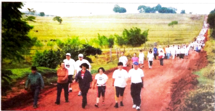
A Caminhada começou no Lago Aratimbó e seguiu pela Estrada Jaborandi, até a estação de captação de água da Sanepar. Participaram crianças, jovens, adultos e muitos idosos

Segundo a comissão organizadora da 2ª Caminhada Ecológica de Umuarama, dos 1.300 inscritos, mais de 800 pessoas com-