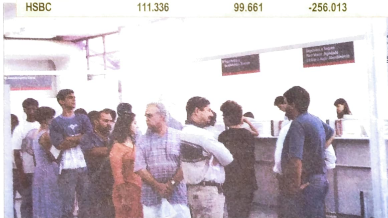
Empregos e atendimento bancário em baixa... Lucros dos banqueiros sobem cada vez mais...