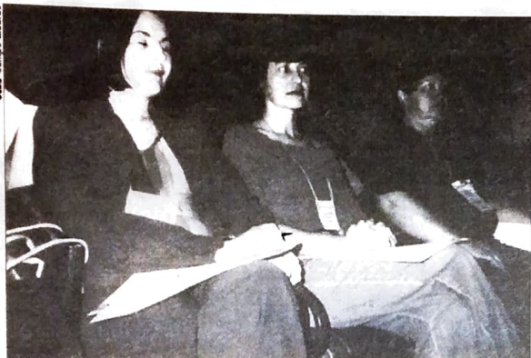
Em Campo Mourão, dois bancários foram eleitos na Conferência para participar do Conselho Municipal da Saúde

E o mais importante: é através das Conferências que a população percebe a força que as leis dão para a fiscalização das verbas públicas destinadas à área da saúde. Os Sindicatos do Pactu participam, através dos seus diretores, dos Conselhos Municipais de Saúde. Esses Conselhos têm o papel de organizar periodicamente as Conferências. No último dia 24 de agosto foi realizada a Conferência Municipal de Saúde de Campo Mourão, onde o Sindicato dos Bancários elegeu dois diretores para o Conselho Municipal de Saúde. Em Umuarama, a Conferência foi realizada nos dias 19 e 20/09, e contou com a participação de diversos bancários.