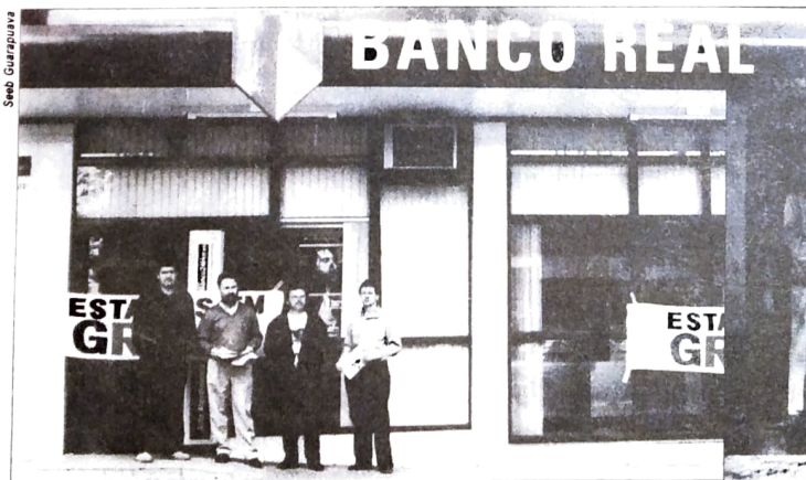
PARALISAÇÕES - O Banco Real é forte no sindicato dos banqueiros. Daí o motivo pelo qual o Pactu paralisou parcialmente as atividades desse banco no último dia 16/09. Também influente é o Unibanco, que tem o presidente da Fenaban. Por isso, o Pactu também paralisou atividades nesse banco, no último dia 11/09, em algumas agências o dia todo. A foto acima é de paralisação no Real de Guarapuava e ao lado no Unibanco de Paranavai.