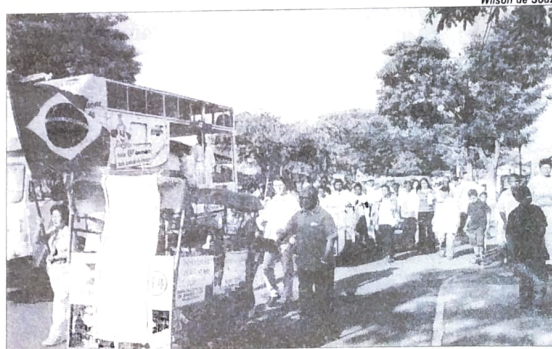
Na base do Pactu, crianças, jovens e adultos participaram do Grito dos Excluídos

O Grito dos Excluídos é organizado pelas Pastorais Sociais da Igreja Católica e teve sua primeira edição em 1995. Todas trabalham temas que buscam resgatar a qualidade de vida, a cidadania e a soberania do povo brasileiro. O 9º Grito foi realizado no dia 7 de setembro e participaram milhões de brasileiros em todo o país.