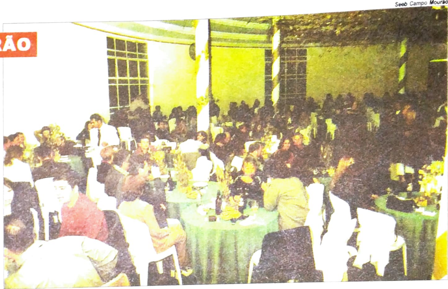
Seeb Campo Mourão

Se repetiu o sucesso do baile promovido pelo Sindicato, já tradicional em comemoração à data. Centenas de bancários, familiares e amigos se divertiram com a festa, animada pela Banda Kaskata.