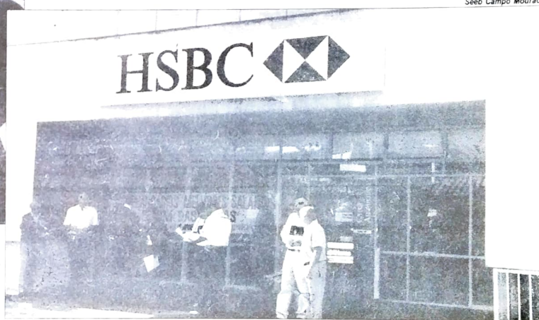
Seeb Campo Mourão