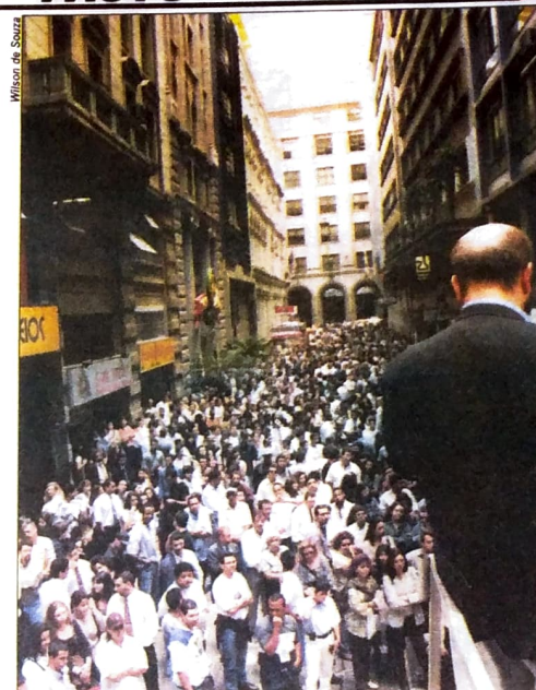
Em São Paulo, maior centro financeiro da América Latina, é onde os bancários têm grande importância nas lutas específicas e nos movimentos populares

Os exemplos vêm do Banco do Brasil e da Caixa Econômica Federal. O BB obteve um lucro líquido de R$ 1,079 bilhão no primeiro semestre deste ano. Esse resultado é 31,1% superior ao de igual período do ano passado. Já a CEF lucrou R$ 860 milhões no semestre e bateu recorde histórico. Mas, diferentemente dos principais bancos privados, BB e CEF dão retorno social. No caso do Banco do Brasil, houve um crescimento de 20,4% da carteira de crédito, ou R$ 68,7 bilhões em financiamentos para a agricultura e às micro e pequenas empresas. Vale lembrar que entre vários outros programas sociais, o BB é responsável pela execução do Pronaf e Pronafinho, que financiam a atividade agrícola brasileira. Já a Caixa, que mantém vários programas de atendimento aos trabalhadores, como o pagamento de PIS, Seguro-Desemprego e FGTS, por exemplo, financiou 13,14% a mais de moradias em relação ao ano passado. Também já está concedendo empréstimos para o programa de microcrédito, com juros de 2% ao mês para pessoas de baixa renda.