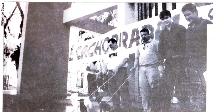
CACHORRADA - Com esse tema os sindicatos do Pactu se manifestaram nas agências do HSBC, no último dia 17/09, mostrando, através de panfletos e carro de som, o desrespeito dos banqueiros aos clientes e usuários (filas, mau atendimento...) e aos bancários (metas pesadas, não reposição da inflação nos salários, etc.). FOTOS: acima na agência de Umarama e ao lado em Campo Mourão.

Os sindicatos do Pactu também mostraram organização e paralisaram várias agências bancárias nos últimos dias, com boa participação da categoria, conforme mostram as fotos abaixo e na página ao lado.