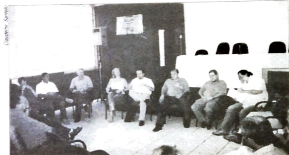
Lideranças sindicais da região em reunião que prepara a fundação da CUT Noroeste, prevista para novembro.