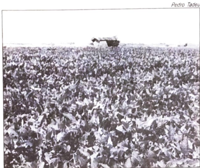
No Paraná, uma lei proíbe o plantio, a comercialização e o transporte de transgênicos