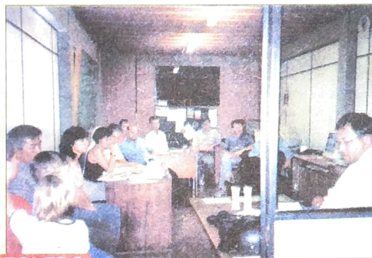
TOLEDO Assembléia BB