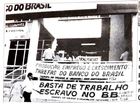
Há muito tempo o movimento sindical denuncia e pede o fim do trabalho escravo no BB e na Caixa

O Pactu espera que esse governo, tenha a sensibilidade de ouvir as queixas dos trabalhadores da Caixa e do BB. E não só na extrapolação de jornada, mas também na reposição da inflação e na participação nos lucros. Ainda sobre a extrapolação, é bom lembrar que três bancários fazendo duas horas extras por dia estão prati-