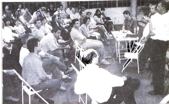
Assembleia dos bancários do BB e da Caixa, em Paranavaí. Os sindicatos do Pactu mostraram organização e conseguiram boa mobilização da categoria

Esses bancários, após dez anos sem fazer uma greve, até porque a repressão era mais dura com o patrão anterior, sofreram perdas salariais, de be-