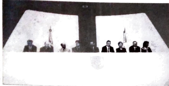
Parlamentares que promoveram o evento e demais convidados à mesa Diretiva, na abertura do seminário