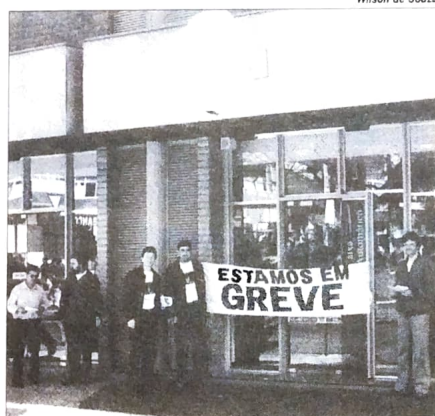
O HSBC mais uma vez intensifica suas demissões às vésperas do Natal, um “presente” de Papai Noel inglês...

Na região do Pactu houve manifestação na base de Toledo. Também no Pactu encerraram as atividades as agências de Pato Bragado (Toledo) Nova Aurora (Umuarama) e Engenheiro Beltrão (Campo Mourão), com duas demissões.