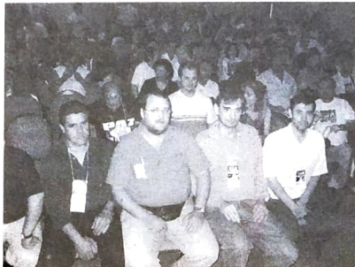
Congresso da Caixa, que aprovou campanha unificada em 2003