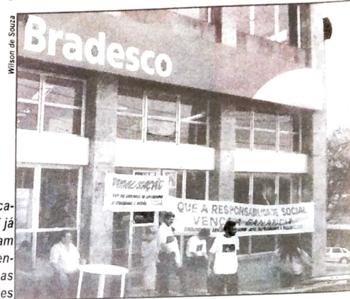
Os sindicatos da CUT já se mobilizam para enfrentar as demissões