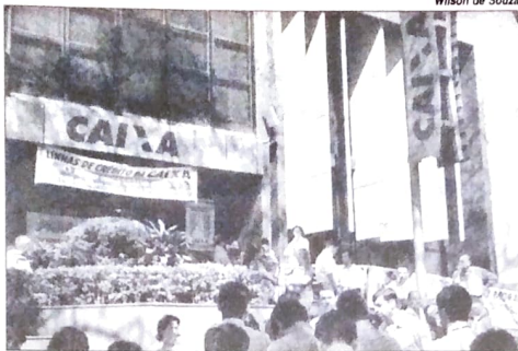
Na Caixa quase foi preciso fazer greve de novo para fazer cumprir o acordo da PLR

Sem muita explicação, a Caixa resolveu baixar para 40% a antecipação da parte variável (80% da remuneração-base, excluindo o CTVA) e 50% do valor fixo. Isso deixou indignados os membros da Comissão Executiva dos Empre-