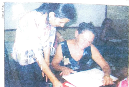
O entusiasmo de aprender supera qualquer dificuldade