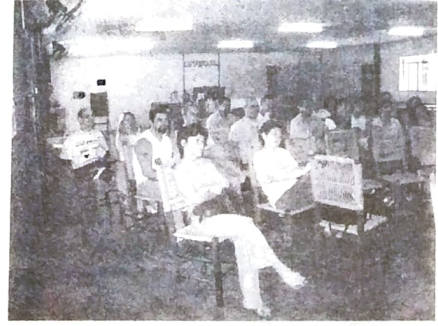
Roni durante palestra no curso, que teve a presença de bom número de dirigentes sindicais de Toledo

Proporcionar motivação e repasse de orientações que podem ajudar muito no dia-a-dia de trabalho no movimento sindical foi um dos objetivos do Curso de Formação Sindical promovido pelo Seeb Toledo. O curso, realizado na sede do Sindicato, aconteceu no último dia 5 de março e contou com palestras proferidas pelo ex-dirigente sindical e atual vereador Valtair Caetano Apolinário e o presidente da CUT-PR, Roni. A direção do Sindicato considerou bom o resultado da promoção.