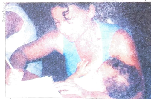
E redundante, porque a imagem fala, mas não dá pra deixar de comentar o esforço da aluna que não quer perder a oportunidade oferecida pela CUT, MEC e Petrobras