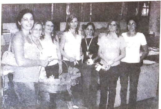
Seeb Toledo distribuiu bombons em homenagem às mulheres

Em Toledo, para comemorar o Dia Internacional da Mulher o Seeb promoveu a distribuição de bombons às mulheres. Também foram divulgadas na imprensa local várias mensagens conscientizando para o fim da violência contra a mulher.