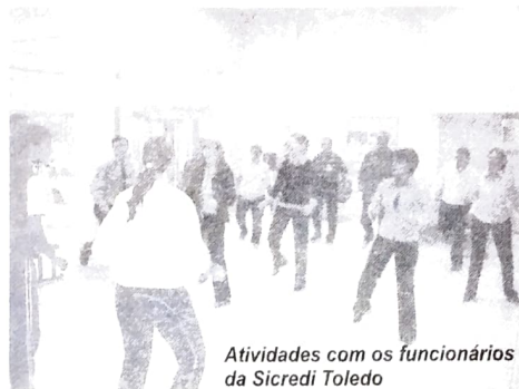
Atividades com os funcionários da Sicredi Toledo

No último 25 de maio foi realizado em diversas cidades do Brasil e de outros países, o Dia do Desafio. Trata-se de uma promoção do Sesc (Serviço Social do Comércio), com objetivo de conscientizar as pessoas contra o sedentarismo e convidá-las a praticar pelo menos 15 minutos de exercícios físicos diariamente. As cidades participantes competiram entre si e foram vencedoras aquelas que conseguiram mobilizar maior número de pessoas. Em Toledo, o Sindicato dos Bancários ajudou na promoção, percorrendo as agências bancárias e envolvendo a categoria em atividades físicas. A participação dos bancários foi fundamental para que Toledo alcançasse o índice de 62,45% de mobilização da população, vencendo a cidade colombiana de Planeta Rica. O Sesc e o Sindicato dos Bancários de Toledo aproveitam para agradecer a todos que se envolveram com as atividades do Dia do Desafio e esperam que, a partir de agora, possam adotar as atividades físicas diariamente como forma de alcançar uma vida mais saudável.