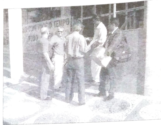
Os Sindicatos do Pactu promoveram manifestações no BB e na Caixa, com distribuição de panfletos à população